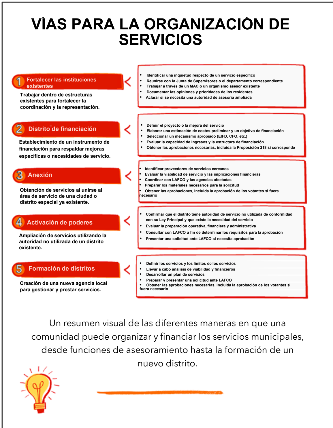
Figura 1: Opciones de gobernanza